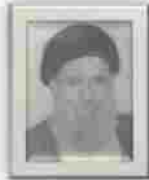
SEYİD SƏLİMAN HÜSEYNİ (1924-?)

“Hüseyni” təxəllüs edən şair Seyid Səliman Hüseyni Mir Ağa oğlu 1924-cü ildə Təbrizdə dindar bir ailədə anadan olmuşdur. O, ruhaniyyət libasını geyinmiş, sadə və yoxsul bir həyat sürmüşdür. Şeir dili olduqca səmimi və xalqvardır, sözün əsl mənasında bir el şairidir. Pəhləvilər dövründə içtimai və tənqidi şeirlər də yazmışdır. Doğulduğu şəhərdə vəfat etmişdir. Əsərləri hələ də kitab kimi çap olunmayıb, yalnız iki şeirini ustad Yəhya Şeyda “Ədəbiyyat ocağı” adlı antologiyasının birinci cildində dərc etdirmişdir.