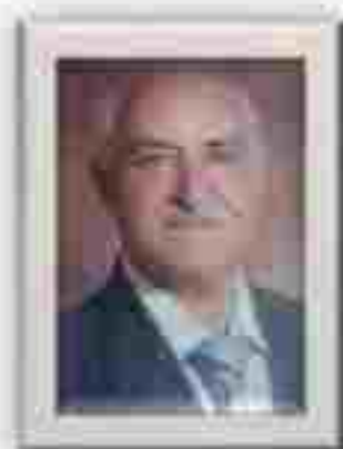
ƏBDÜLƏLİ MÜCAZİ (1934)

Şeirələrində "Aslan" təxəllüs edən Əbdüləli Mucazi Yusif oğlu 1934-cü ildə Şobistər mahallının adlı-sarıq qəsəbələrindən olan Şancın kəndində bir ikinci ailəsində dünyaya gəlir. O, 11 yaşındakı savadsız qalır və Azərbaycanda Milli Hökumət qurulan ili təhsilin icbari və pulsuz olduğuna görə o da milyonlar insanı kimi təhsilə başlamıq imkanı tapır və ana dilində ilk təhsil ala bilənlərdən olur. 12 yaşında Milli Hökumət dağıdılan zamanı ailəliklə Tehrana köçür və orada fars dilində təhsil almalı olur və orta məktəbi bitirəndən sonra məşğ təmin etmək üçün bir şirkətdə işə başlayır. 1967-ci ildə Tehrandə ailə qurur. O, ana dilimizi sevdiyinə görə dilimizdə olan kitabların mütaləsilə məşğul olur. dilimizi öyrədir, ədəbi məclislərdə və dərnlərdə fəaliyyət göstərir. Gözəl qəşmə, gəraylı və bayatılar yazır.